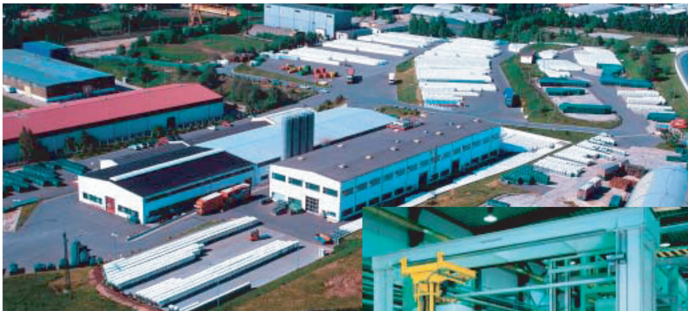
Productiebedrijf te Bischofswerda BRD